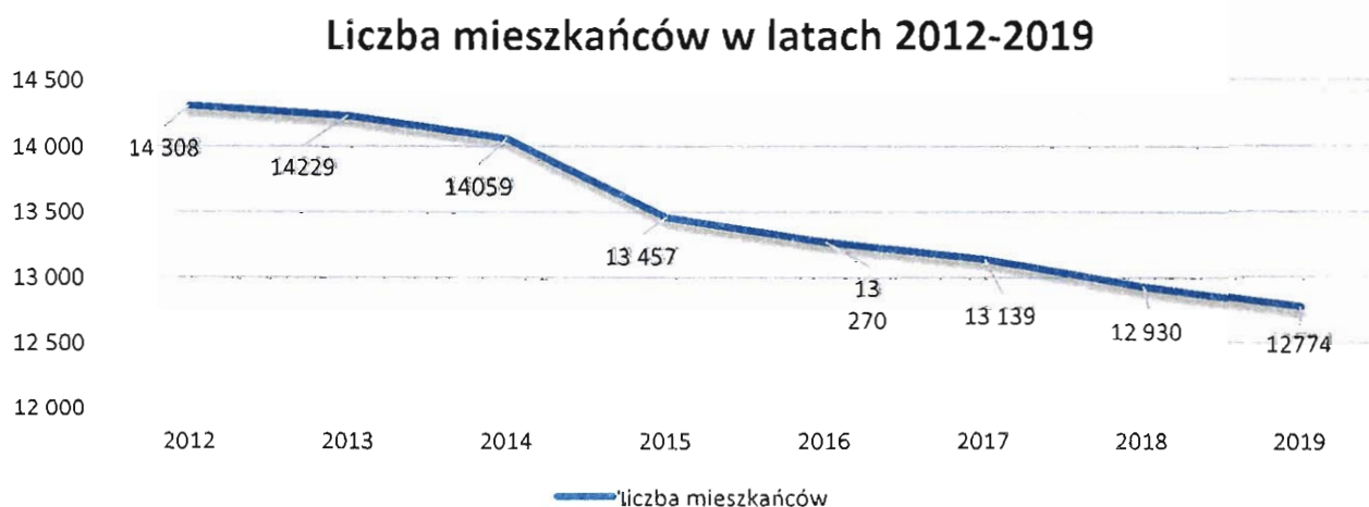
Wykres 1. Liczba mieszkańców w latach 2012-2019

Źródło: Wybrane dane statystyczne, Powiat Sławiński, Gmina Miejska Darłowo, Urząd Statystyczny w Szczecinie, 2019