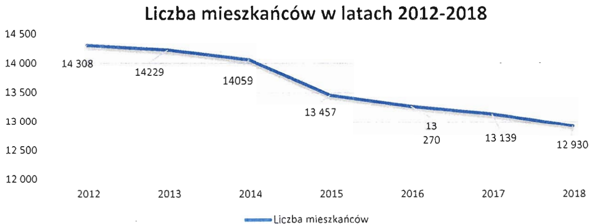
Wykres 1. Liczba mieszkańców w latach 2012-2018

Źródło: Wybrane dane statystyczne, Powiat Sławiński, Gmina Miejska Darłowo, Urząd Statystyczny w Szczecinie, 2018