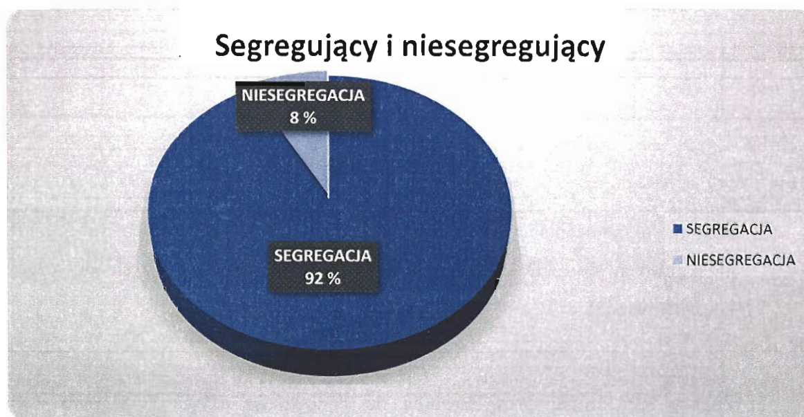
Wykres 3. Deklarujący segregację i niesegregację