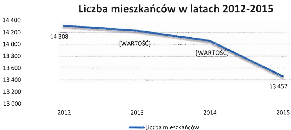
Wykres 1 Liczba mieszkańców w latach 2012-2015

Źródło: Wybrane dane statystyczne, Powiat Sławieński, Gmina Miejska Darłowo, Urząd Statystyczny w Szczecinie, 2015